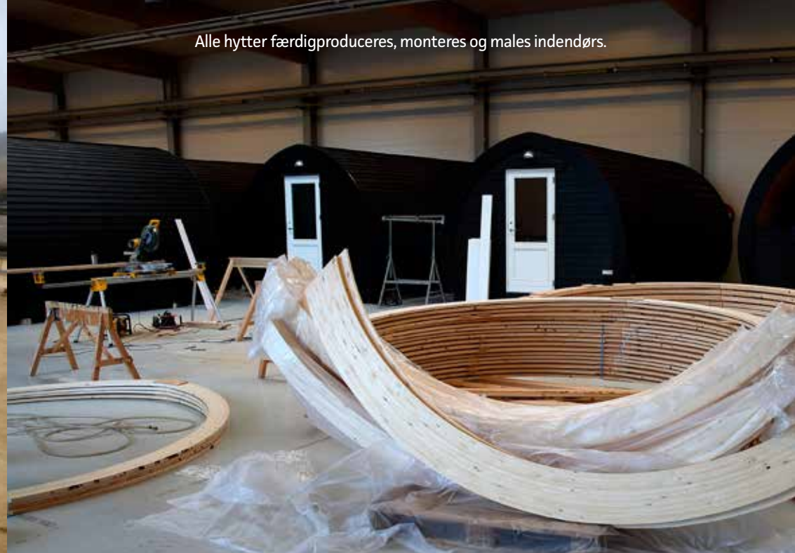
Alle hytter færdigproduceres, monteres og males indendørs.