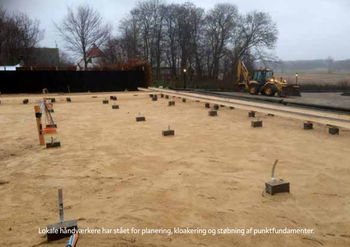
Lokale håndværkere har stået for planering, kloakering og støbning af punktfundamenter.