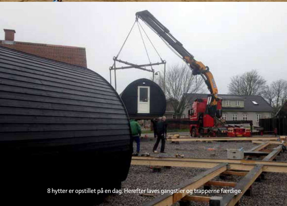
8 hytter er opstillet på en dag. Herefter laves gangstier og trapperne færdige.